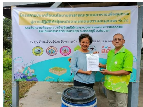
บันทึกข้อตกลงการขับเคลื่อนนโยบายสาธารณะ เพื่อพัฒนาระบบอาหารสุภาพ