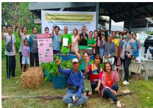
หน่วยงานระดับพื้นที่นำนโยบายสู่การปฏิบัติ

3. เกิดบูรณาการความร่วมมือและทรัพยากรจากหลายภาคส่วนที่เกี่ยวข้องร่วมกัน เพื่อให้เกิดผลสัมฤทธิ์ที่เป็นรูปธรรม